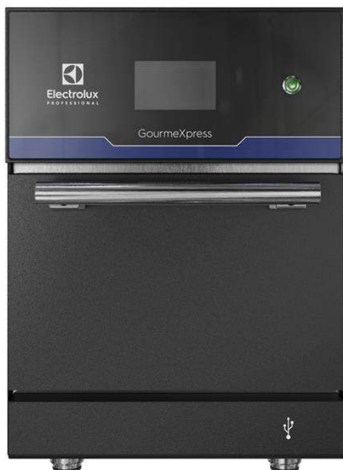
603955 GourmeXpress High Speed ugn (3,5kW) med (EPRPROSITEU) enkel magnetron 230V/1N/50Hz